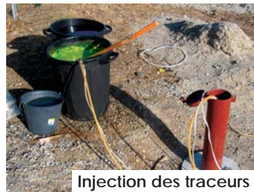
Injection des traceurs