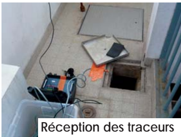
Réception des traceurs