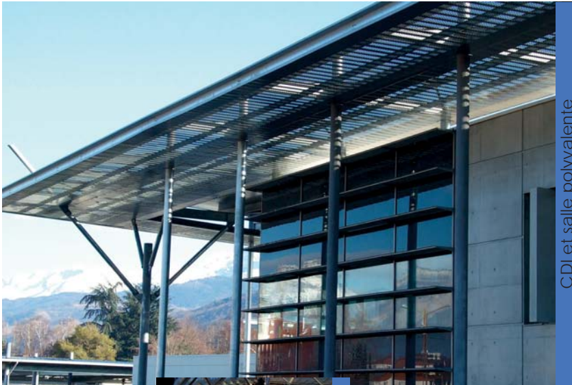
CDI et salle polyvalente