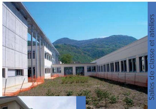
Salles de classe et ateliers