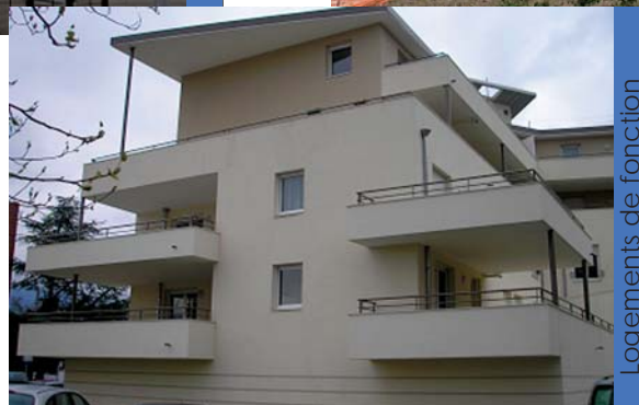
Logements de fonction